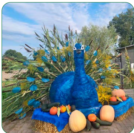
Sołectwo Bruki Kokocka