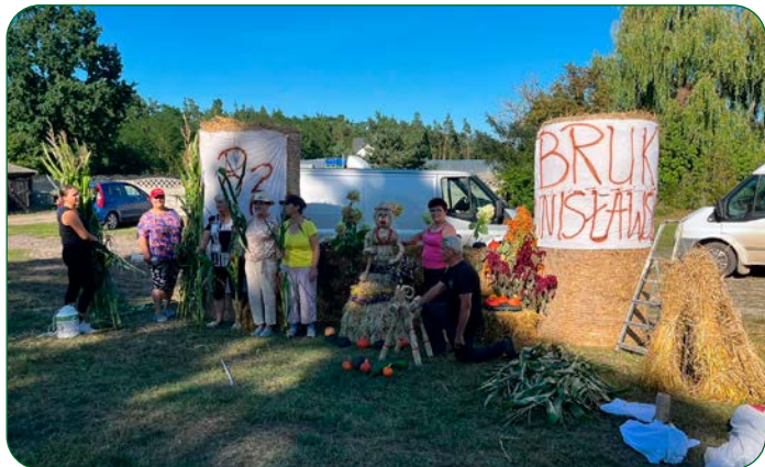
Sołectwo Bruki Unisławskie